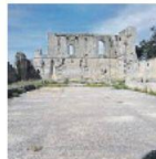
Il Castello Svevo